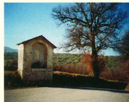
Maestà lungo il percorso

I monumenti: a S. Sabino meritano una visita la pieve di S. Lorenzo (XIII sec.) e l'ulivo secolare di Macciano.