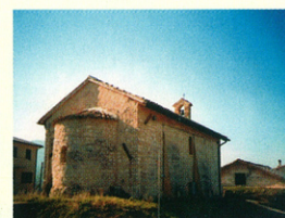
S. Sabino_chiesa di S.Lorenzo